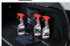
Zestaw kosmetyków samochodowych Toyota Kosmetyki