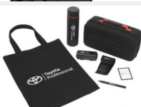
Zestaw prezentowy Professional Gadżety